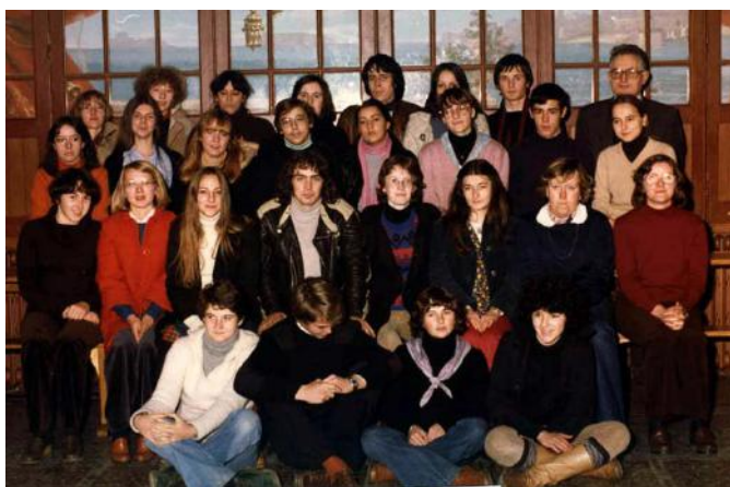
Terminale A 1977-1978