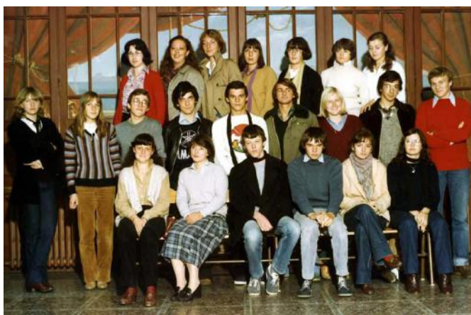
Terminale B 1979-1980