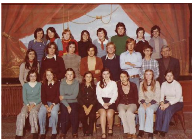
Terminale D 1975-1976