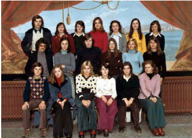
Terminale A 1974-1975