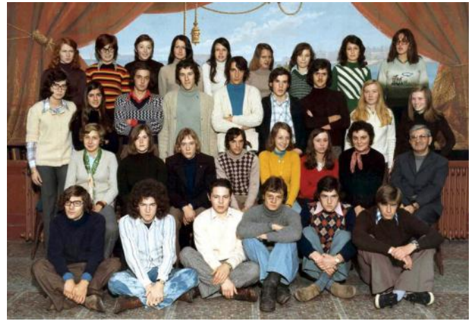
Terminale D 1974-1975