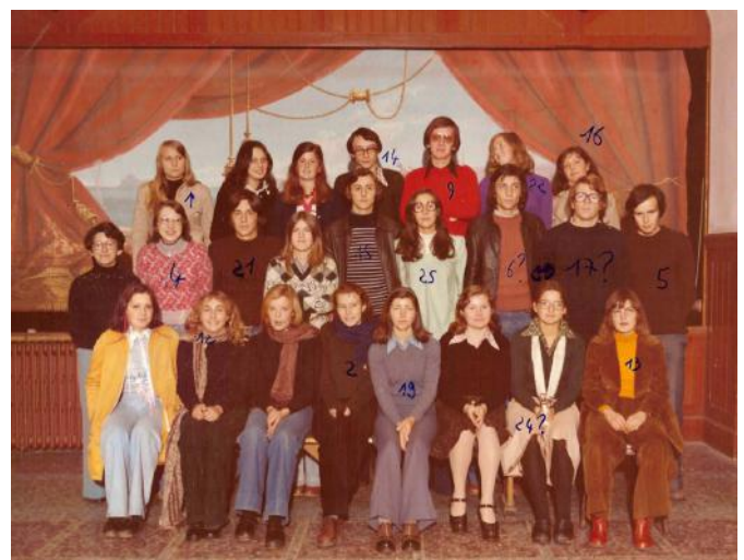
Terminale B 1975-1976