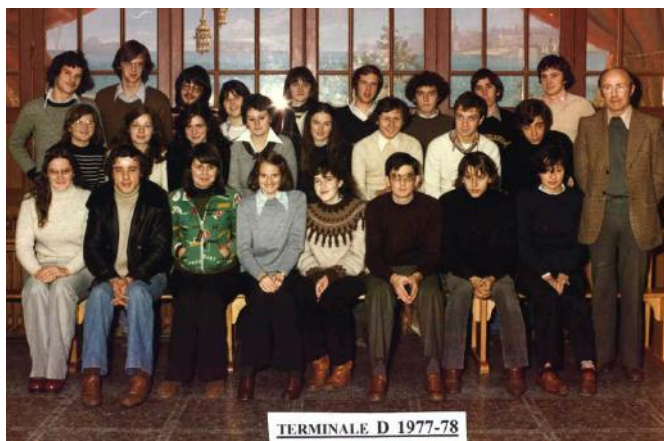
Terminale D 1977-1978