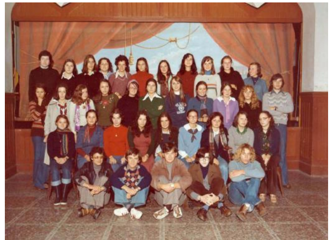
Terminale A2 1975-1976