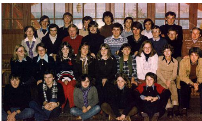
Terminale C 1977-1978