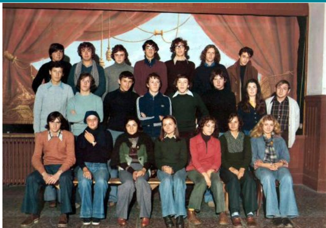
Terminale C 1975-1976