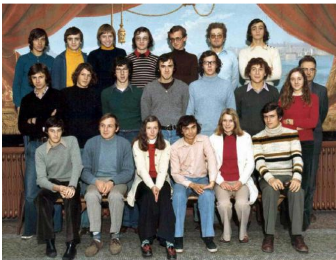
Terminale C 1974-1975