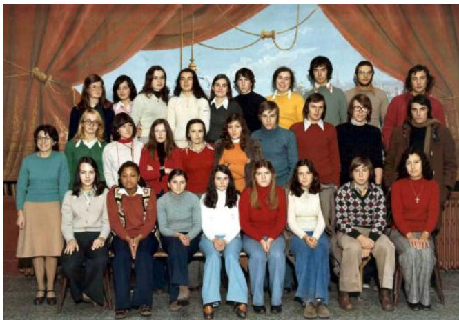
Terminale B 1974-1975