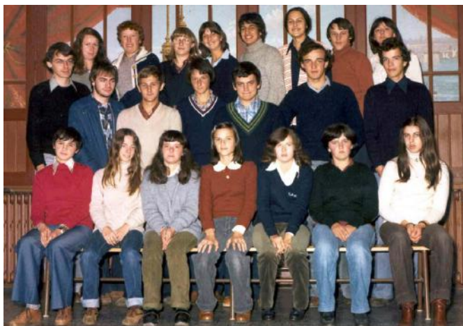
Terminale Dbis 1978-1979