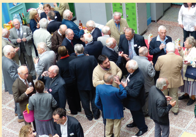
Détente autour d'un verre

Pour contacter l'Amicale : Secrétariat : mardi, mercredi, vendredi de 10 h à 12 h Téléphone : 02.99.40.74.87 - E-mail : aaism@free.fr - Site Internet : www.aaism-lapro.com