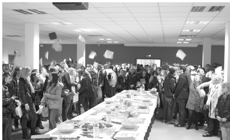
Remise des diplômes - Septembre 2013