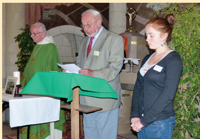
Moment de recueillement