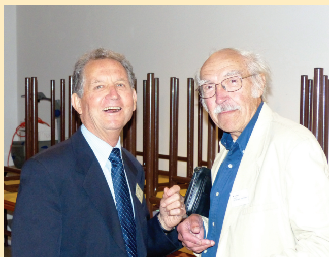
Heureuses retrouvailles au bout de 60 ans