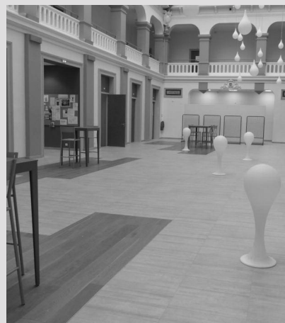
Les devises Semper Fidelis et ciné macula ont été conservées

Les anciens élèves qui participeront à notre évènement du 28 décembre prochain, « Réveillons les Anciens » auront tout le loisir de le découvrir puisque c'est là que nous nous réunirons. Merci à l'OGEC et à Mr JOBY pour ce grand coup de jeune !