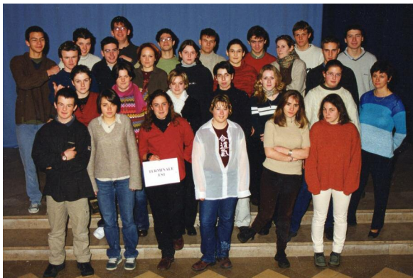
Terminale ESI - 2001