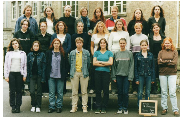
Terminale STT - 2001