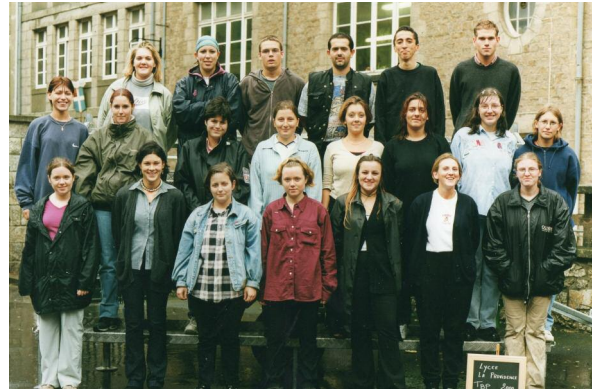
Terminale Pro Bureautique - 2001

Outre le plaisir de se retrouver, c'est aussi l'occasion de prendre des contacts, de nouer des liens et d'agrandir ses réseaux, indispensables dans notre société actuelle.