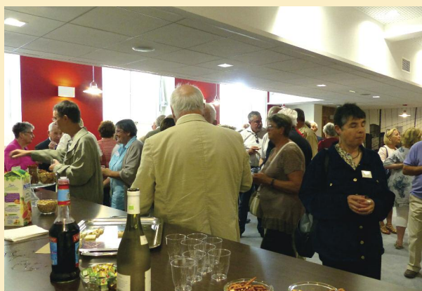
L'apéritif de l'assemblée générale