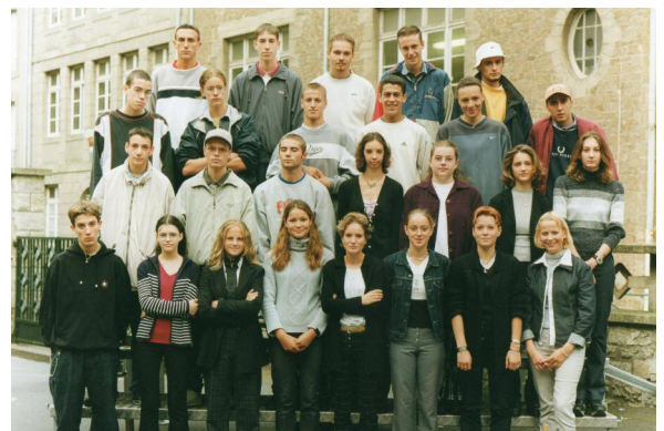
Terminale VAMI - 2001