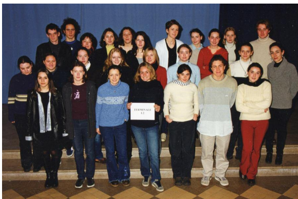
Terminale L2 - 2001