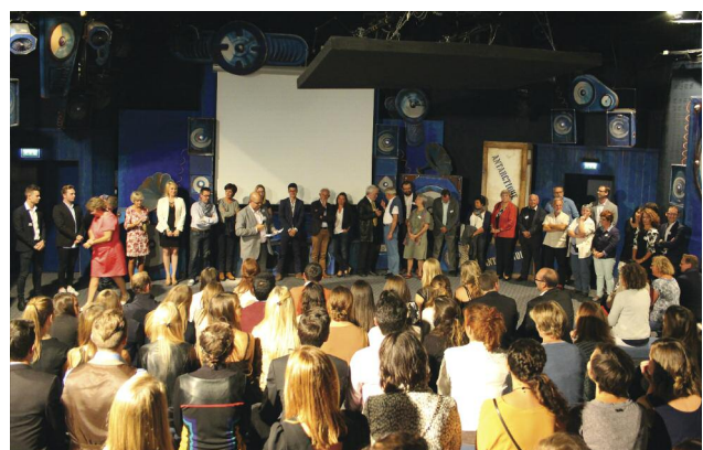
La fête BTS CI bat son plein