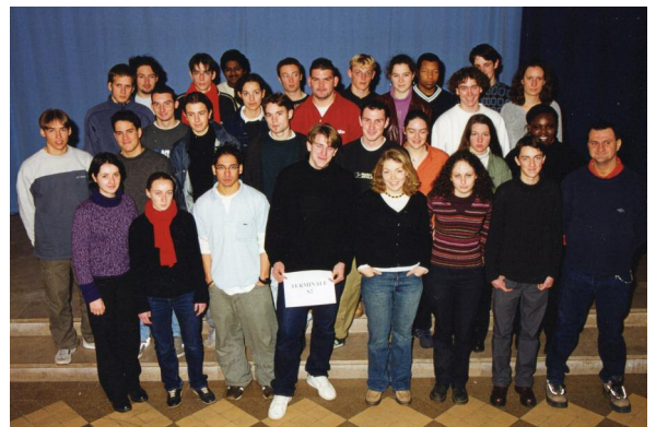
Terminale S2 - 2001