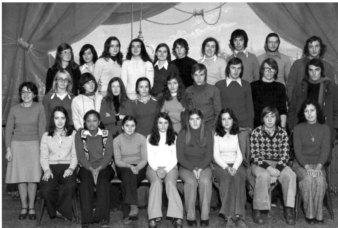
Terminale B - 1975