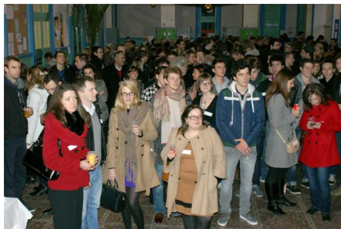
Réveillon des anciens de l'ISM-LAPRO 2011

Merci de faire passer l'info dans votre réseau d'anciens élèves !